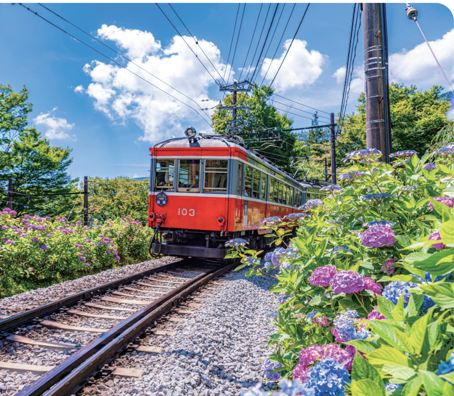
箱根登山電車 ● 箱根町

青山メインランドファンタジースペシャル『ピーター・パン』のご案内／健康に良い料理教室 ／大磯ロングビーチ／箱根小涌園ユネッサン（水着エリア）／東京ディズニーリゾート®／ 横浜銀行アイスアリーナ／サンリオピューロランド／家庭常備薬等の斡旋／各種小冊子