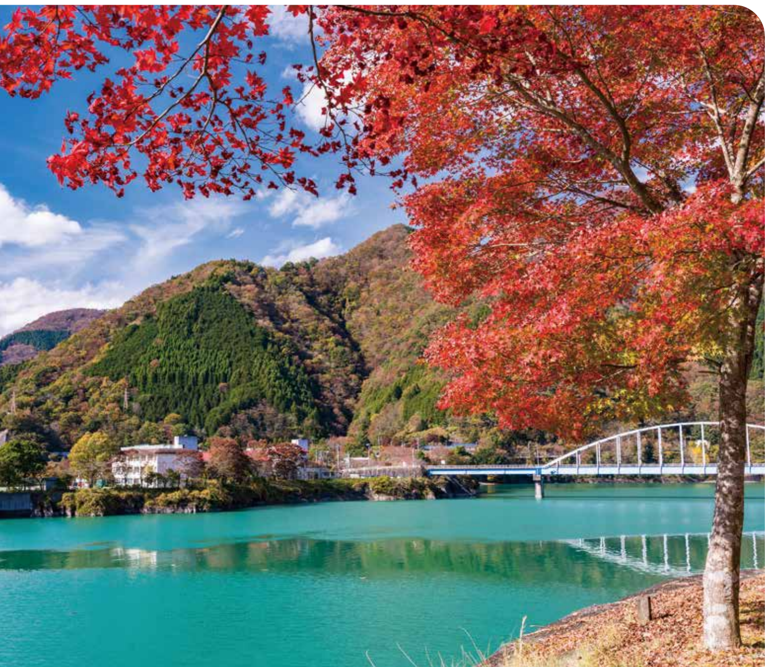
丹沢湖の湖畔の紅葉 ● 山北町

ボウリング教室・ボウリング大会／健康に良い料理教室／横浜銀行アイスアリーナ／観劇のご案内／業務災害補償制度 ほか