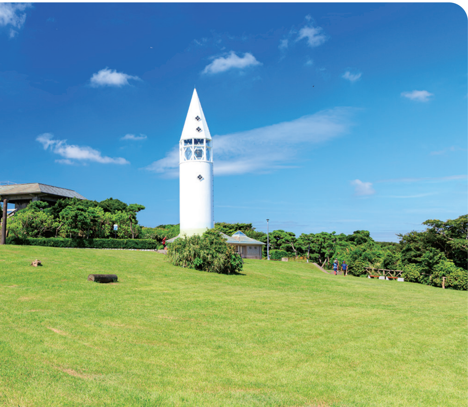
安房埼灯台 ● 三浦市

みかん狩り／健康に良い料理教室／コンサートのご案内／年金とライフプランセミナー／秋のさわやかウォーキング ほか